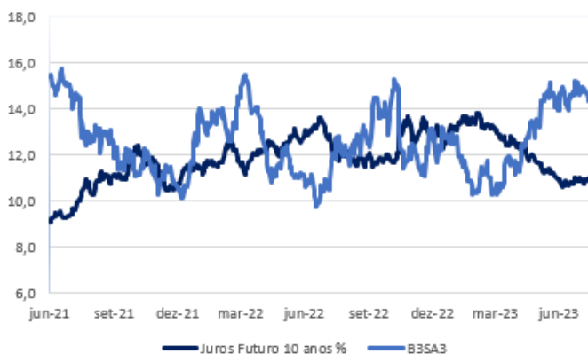
Figura 1. Correlação inversa entre o juros 10a e a B3SA3